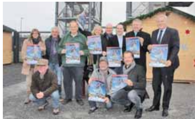
Veranstalter, Aussteller und Offizielle freuen sich auf einen schönen Weihnachtsmarkt am Indemann.

Auch der Verein Lichtblicke e.V., den Familie Lersch seit Langem tatkräftig unterstützt, ist wieder vertreten. Die ehrenamtlichen Helfer bieten unter anderem selbstgemachte Köstlichkeiten wie Eier- und Kinderpunsch und von den Kindern gebackene Kekse an. Alle Spenden und Einnahmen werden für die tolle Arbeit des Vereins eingesetzt, der unter anderem krebserkrankte Kinder und deren Familien unterstützt ( www.lichtblicke-aachen.de ).