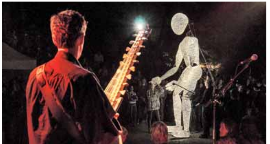
DUNDU heißt die Großpuppe, die am Samstag auf dem Marktplatz für Aufsehen sorgen wird.

Durch ihre vierzehn Glieder, die von einem fünfköpfigen Team von Puppenspielern animiert werden, ist die Großpuppe dazu noch erstaunlich beweglich. Die streng figurlich gehaltene Gestalt verleiht ihr eine universelle Persönlichkeit, die dem Zuschauer Raum bietet für eigene Projektionen. Hinzu kommen die freie Spielbarkeit und sehr menschliche Bewegungen von DUNDU, die einzigartige Interaktionen mit dem Publikum ermöglichen. Ein faszinierendes Erlebnis.