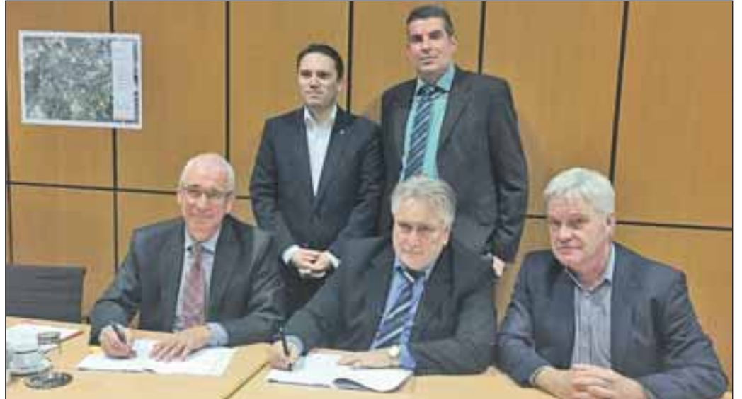
Im Rathaus wurde die Konsensvereinbarung zwischen Flächenpool NRW und der Stadt Eschweiler unterzeichnet.

gezielt zu einer positiven Entwicklung der Stadt Eschweiler beitragen. Als erster Schritt wurde nun im Rathaus die Konsensvereinbarung zwischen Flächenpool NRW und der Stadt Eschweiler unterzeichnet. Dies war zugleich Startschuss zur Ansprache der Eigentümer. Die Eigentümeransprache beginnt noch in 2016 an drei gemeldeten Standorten. Die Ansprache an den übrigen Standorten erfolgt im Laufe des Jahres 2017.