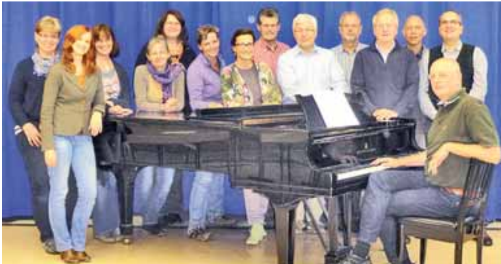
Der Kammerchor ist am 11. Dezember in der Pfarrkirche St. Peter und Paul zu Gast.