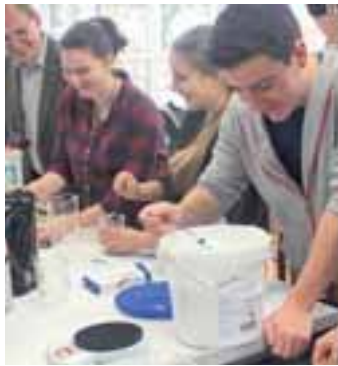
Bei der offiziellen Eröffnung präsentierten Schülerinnen und Schüler der Oberstufenkurse vier spannende Experimente.

Eschweiler. Das lange Warten hat sich gelohnt. Nach einer aufwändigen Umbauphase wurden die neuen Chemieräume am Städtischen Gymnasium nun offiziell eröffnet. Schülerinnen und Schüler der Oberstufenkurse zeigten dabei, wie ansprechend sich Unterricht jetzt durch die neue Praxisnähe der Räume gestalten