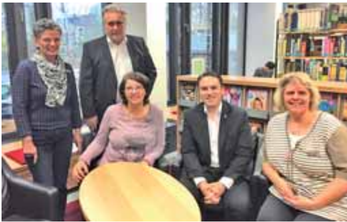
Anlässlich des „Tages der Medienkompetenz 2016“ besuchte der SPD-Landtagsabgeordnete Stefan Kämmerling die Stadtbücherei Eschweiler.

Der Besuch ist eine von mehreren „Aktionen vor Ort“ im Vorfeld des Tags der Medienkompetenz. Abgeordnete des Landtags Nordrhein-Westfalen besuchen im Oktober und November 2016 eine ausgewählte Einrichtung in ihrem jeweiligen Wahlkreis. Diese lokalen Aktionen dienen dazu, die Bedeutung der Medienbildung im Dialog zwischen der Politik und einzelnen Bildungseinrichtungen beispielhaft herauszustellen.