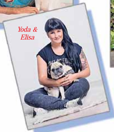
Yoda & Elisa