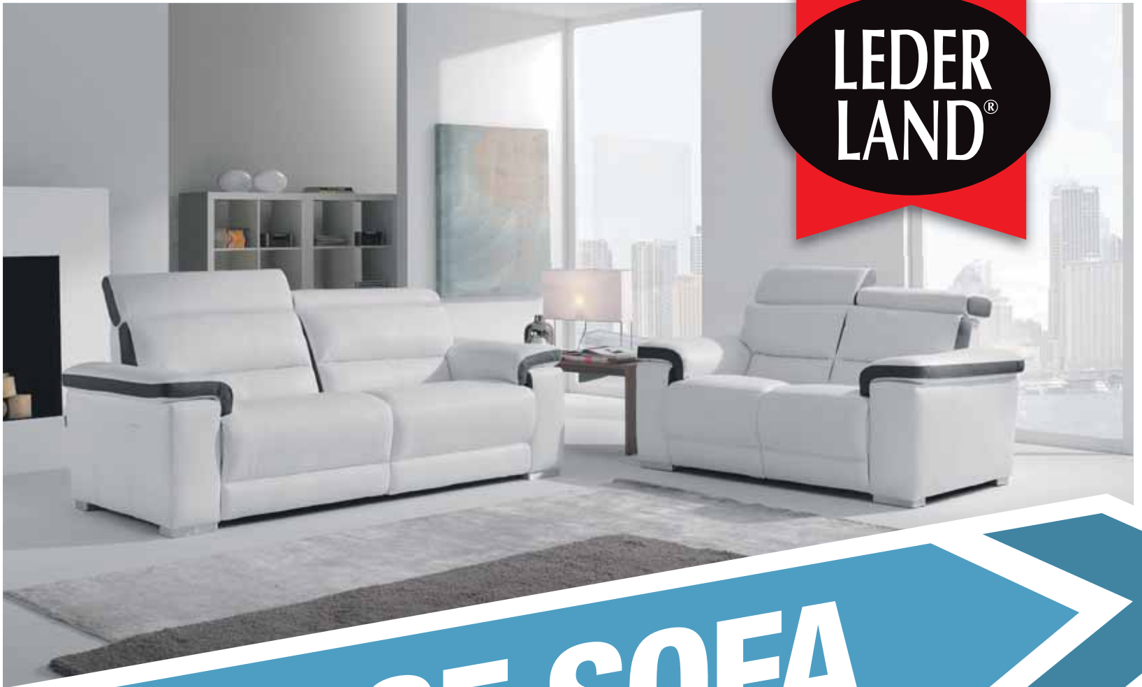
*Je nach Zustand Ihrer Sitzgruppe beim Ankauf einer 5-sitzigen Ledergarnitur.